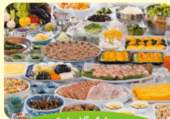
朝食もバイキング

レストラン(フォレストガーデン)にて食べ放題&飲み放題。繁忙期は17:00~17:30入場、19:00~19:30入場の2部制となります。(19:30最終入場) ご到着時先着順で時間のご案内を致します。※お日にちによってご案内時間は変更となる場合がございます。