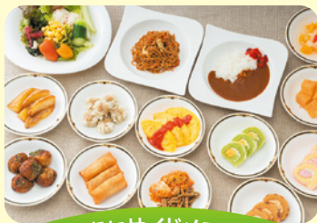
豊富なサイドメニュー